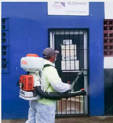
Limpieza y Desinfección