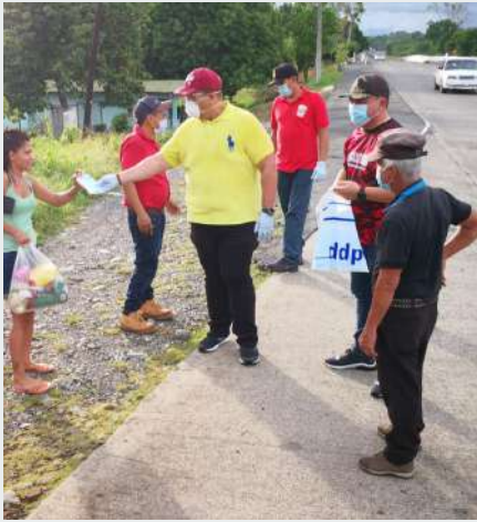
Entrega de Artículos y bolsas de comida