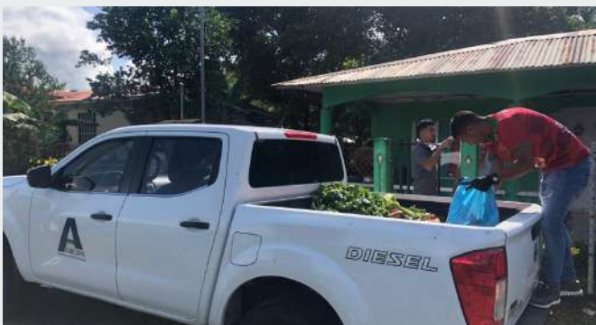
La Regional de Chiriquí - Bocas del Toro:

La Regional de Chiriquí - Bocas del Toro continúa brindando apoyo a los municipios de la región. Esta ayuda consiste en la movilización de personal y equipo. También parte del personal trabaja en la recolección de legumbres y hortalizas.